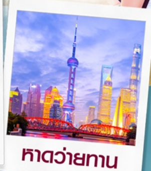
ทาดว่ายทาน