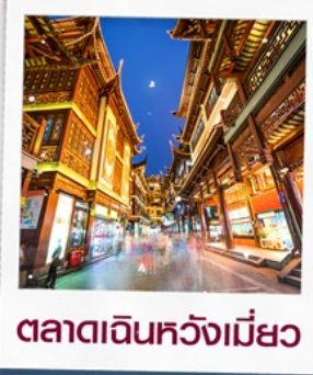
ตลาดเดินหัวงเมี้ยว