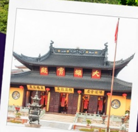
วัดพระหยก