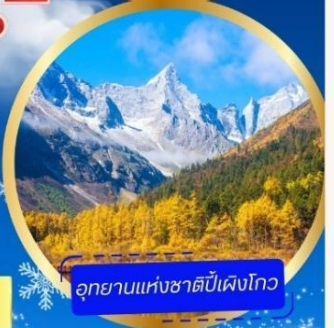
อุทยานแห่งชาติปี้เผิงโกว

อุทยานภูเขาสี่ดรุณี หุบเขาของเสี่ยวโกว (รวมรถอุทยาน) อุทยานปี้เผิงโกว (รวมรถอุทยาน + รถแบตเตอรี่) ภูเขาหิมะการ์เซียต้ากู่ปิงชว่น (รวมรถอุทยาน + กระเช้า) - วัดต้าฉือ ดินแดนเดินชุนซีลู่ - ชมแสงสี The Tower of Life ที่ลานห้าง SKP ถนนคนเดินชอยกวางแจม - POP MART