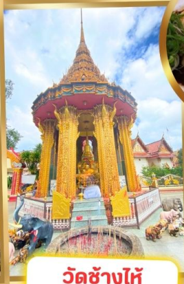
วัดช้างไห้