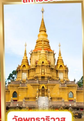
วัดพุทธาริวาส