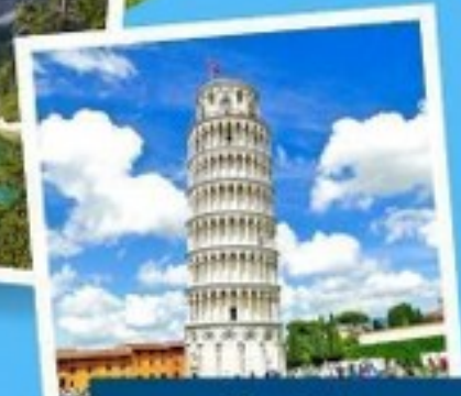
เมืองปิซา