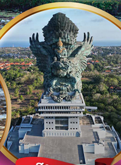
สวนวิษณุ