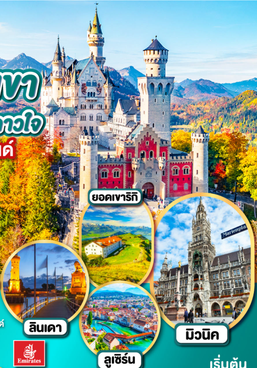
ยอดเขารีกิ