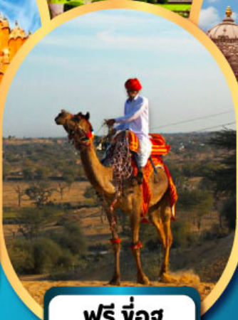
ฟรี ขี่อู เมืองมันทวา