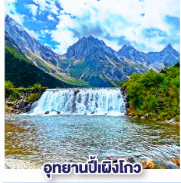
อุทยานป่าฝิ่งโกว