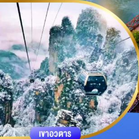
เขาวงตาร