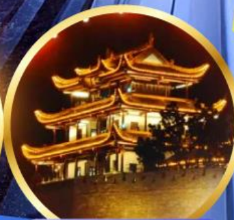
หอคอยทองคำเทียนซิน