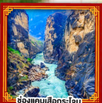
ช่องแคบเสือกะโจน