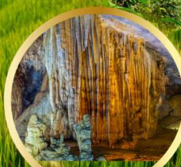
ถ้ำสวรรค์