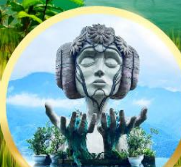
โมนาน่า ซาปา คาเฟ่