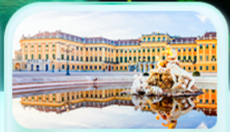
พระราชวังเซินบรุนน์