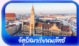
จัตุรัสมาเรียนพลาทซ์