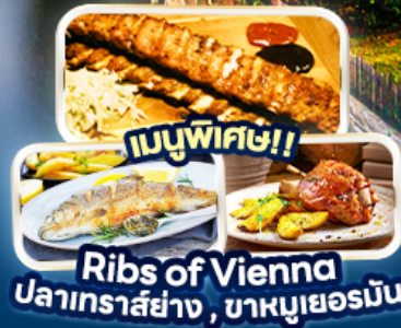
Rib's of Vienna ปลาเทราสย่าง, บาหมูเยอรมัน