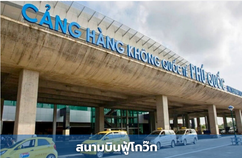
สนามบินฟู้โก๊วก