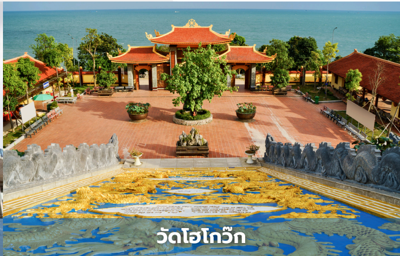
วัดโฮโก๊วก