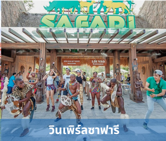
วินเพิร์ลซาฟารี