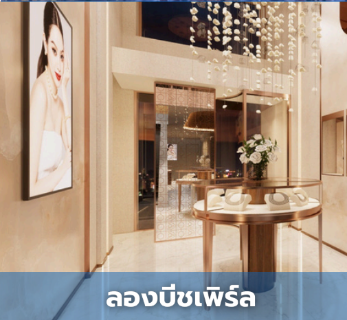
ลองบีชเพิร์ล