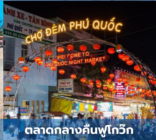
ตลาดกลางคืนฟูโก๊วก