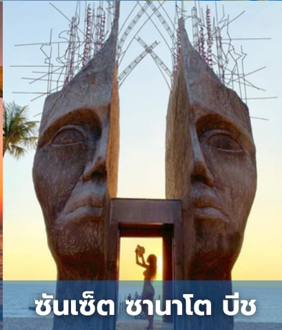
ซันเซ็ท ซานาโต บีช