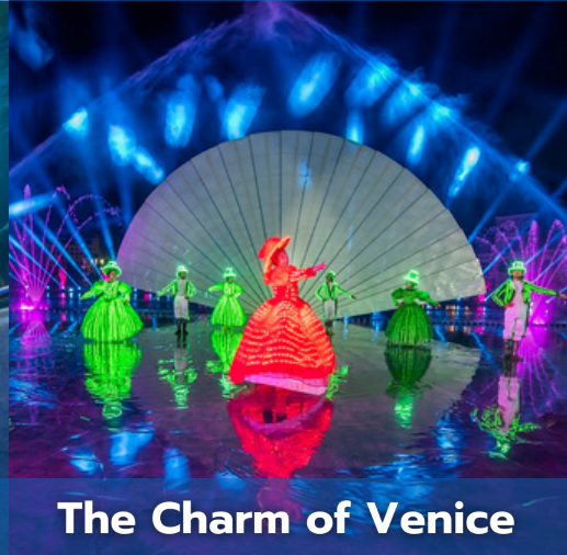
The Charm of Venice