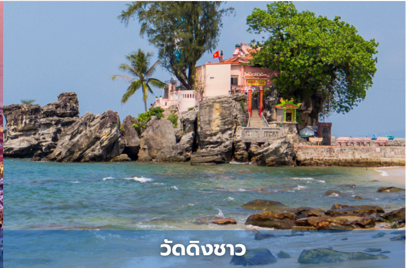
วัดดิ้งซา