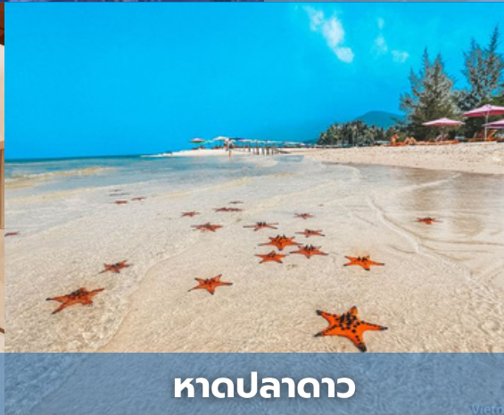
หาดปลาดาว