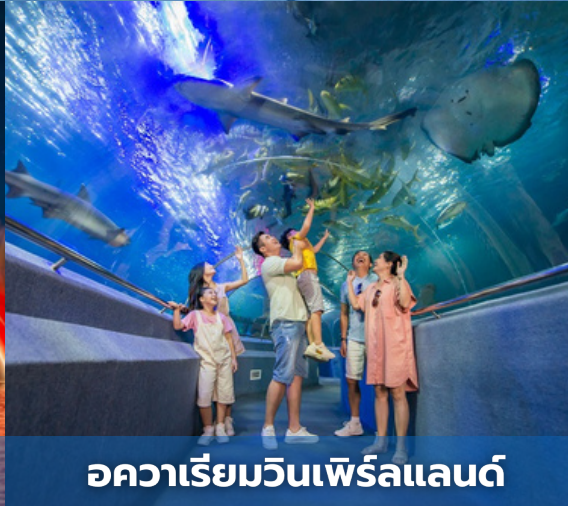
อควาเรียมวินเพิร์ลแลนด์