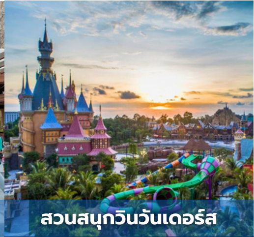
สวนสนุกวินวันเดอร์ส