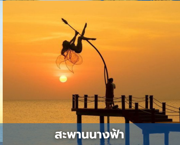
สะพานนางฟ้า