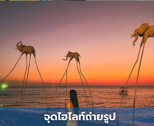
จุดไฮไลท์ถ่ายรูป