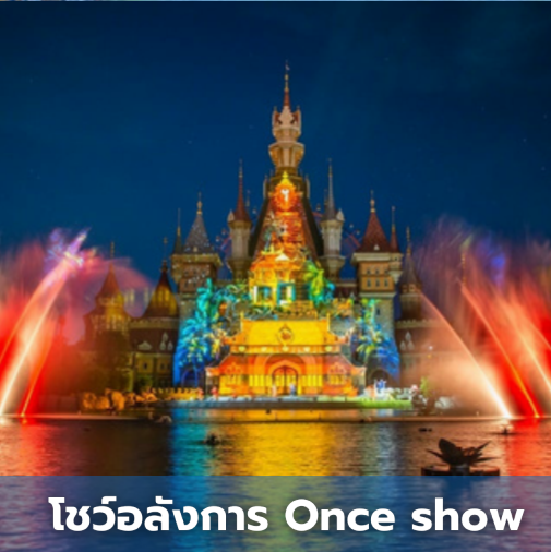
โชว์อลังการ Once show