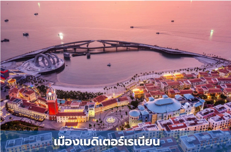
เมืองเมดิเตอร์เรเนียน