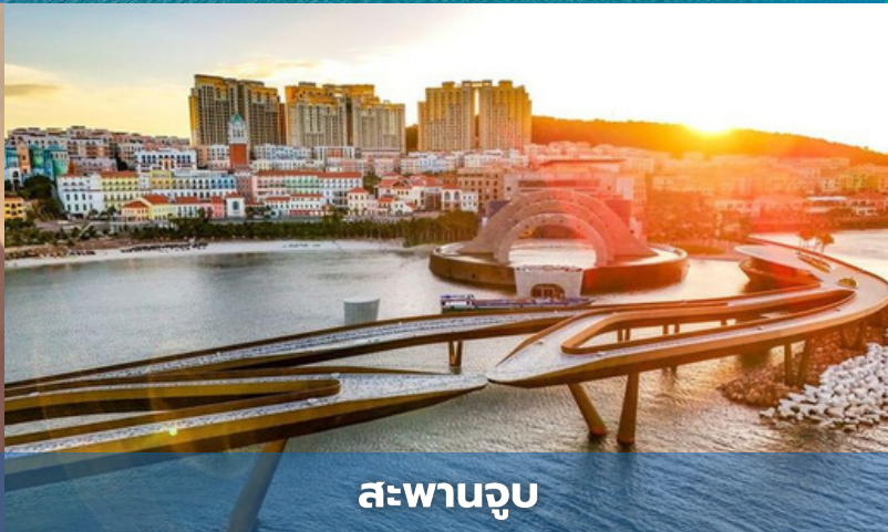
สะพานจูบ