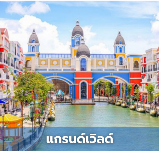
แกรนด์เวิลด์