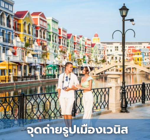
จุดถ่ายรูปเมืองเวนิส