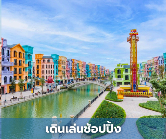
เดินเล่นช้อปปิ้ง