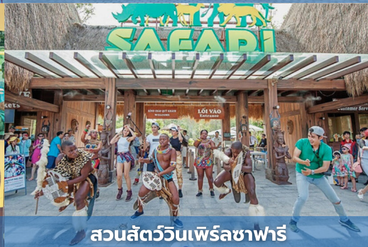
สวนสัตว์วินเพิร์ลซาฟารี