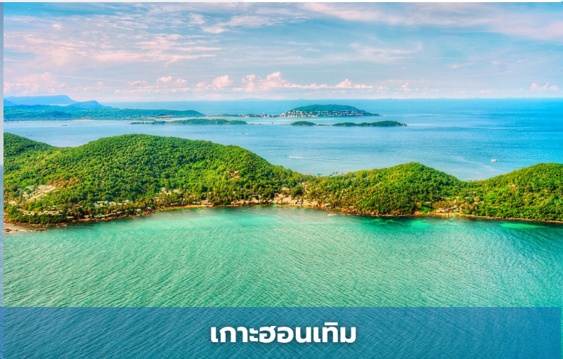
เกาะฮอนเท็ม