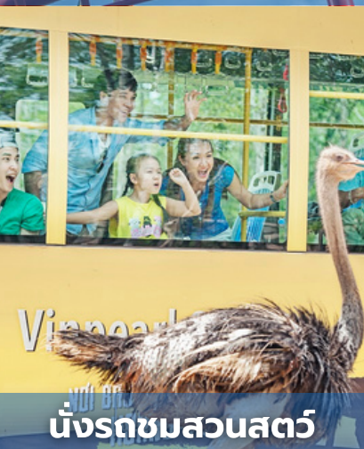
นั่งรถชมสวนสัตว์