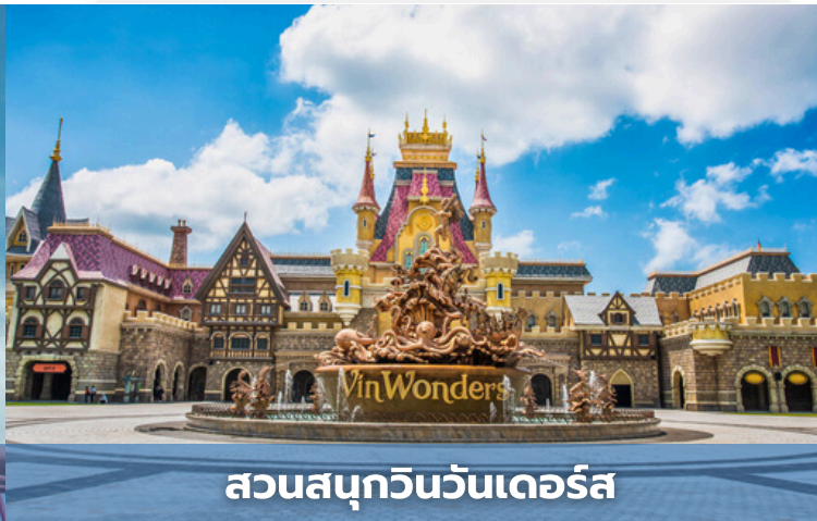
สวนสนุกวินวันเดอร์ส