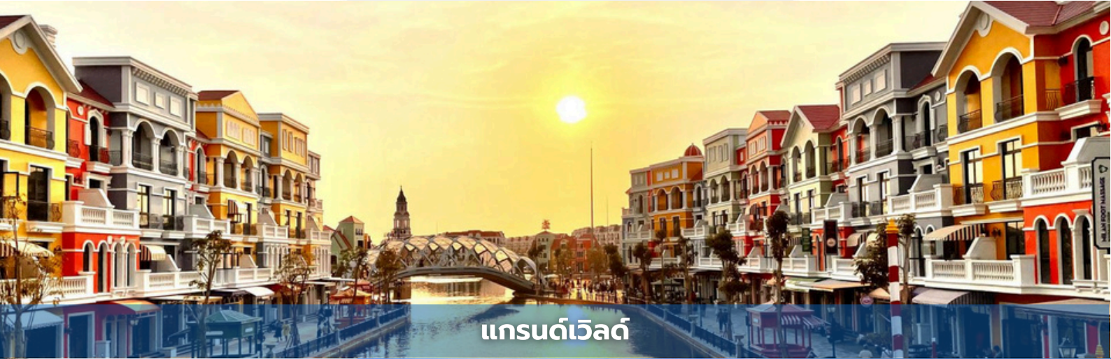
แกรนด์เวิลด์