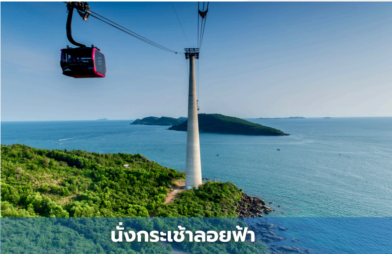
นั่งกระเช้าลอยฟ้า