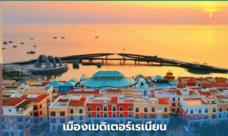
เมืองเมดิเตอร์เรเนียน