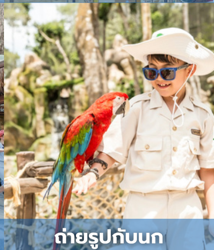
ถ่ายรูปกับนก