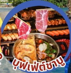
บุฟเฟ่ต์ชาบู