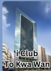
i Club To Kwa Wan