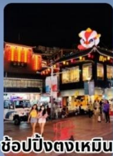
ช้อปปิ้งตงเหมิน