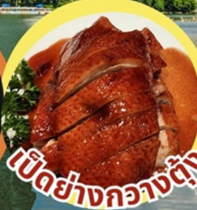
เป็ดย่างกวางตุ้ง