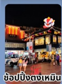
ช้อปปิ้งตงเหมิน