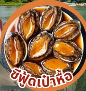
ซีฟู้ดเป่าหื้อ