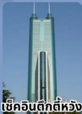
เช็किनตึกทีห้วง