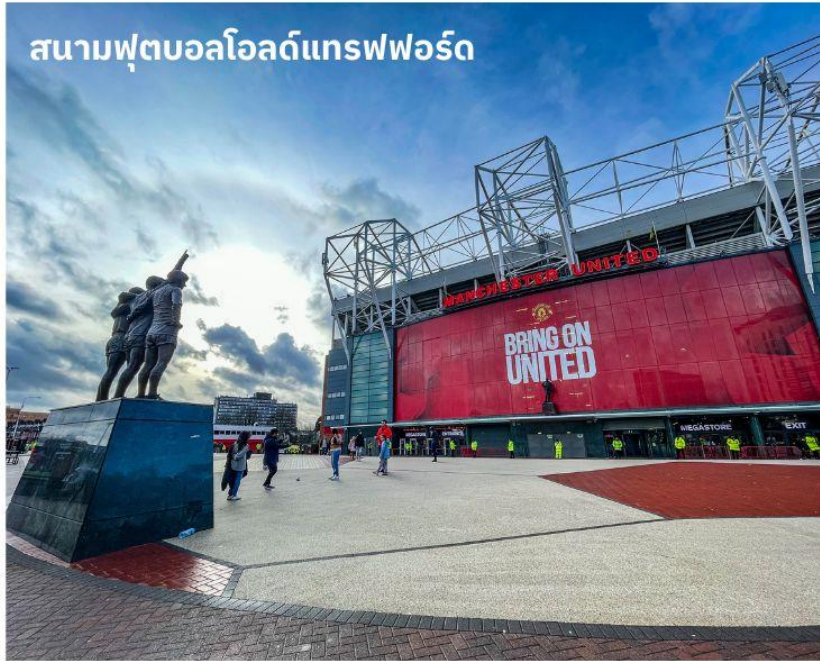
สนามฟุตบอลโอลด์แทรฟฟอร์ด

จากนั้นนำท่านเดินทางสู่ เมืองแมนเชสเตอร์ ใช้เวลาเดินทางประมาณ 1 ชั่วโมง เป็นอีกหนึ่งเมืองท่าที่สำคัญของประเทศอังกฤษและยังเป็นเมืองที่มีประชากรมากที่สุดเป็นอันดับสองของประเทศอังกฤษ รองจากมหานครลอนดอน จากนั้นนำท่านถ่ายรูปด้านหน้า สนามฟุตบอลโอลด์แทรฟฟอร์ด แห่งทีมแมนเชสเตอร์ ยูไนเต็ด สโมสรฟุตบอลชื่อดังโลกที่มีสมาชิกแฟนคลับมากที่สุดในโลก เจ้าของสมญานาม “ปีศาจแดง” สนามเริ่มก่อสร้างในปี 1909 และเริ่มใช้ตั้งแต่ปี 1910 ปัจจุบันมีความจุ 76,212 คน