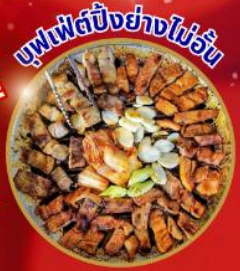
บุฟเฟ่ต์ปิ้งย่างไม่วัน