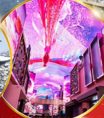
INSPIRE Entertainment Resort

ชมจอ LED ขนาดยักษ์ที่รีสอร์ท 5 ดาว ใหญ่ที่สุดในเอเชียเหนือ ชมพระราชวังคยองบกคุง ย่านอดีตหมู่บ้านบุคซอน ฮงแด ใส่ชุดฮันบก ทำข้าวห่อสาหร่าย อิสระช้อปปิ้ง Lotte Duty Free