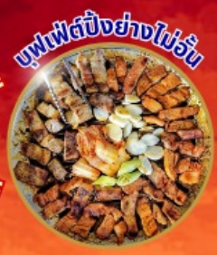
บุฟเฟ่ต์ปิ้งย่างไม่เว้น