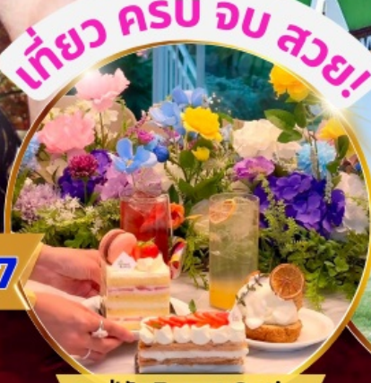
คาเฟ่ดัง Forest Outing