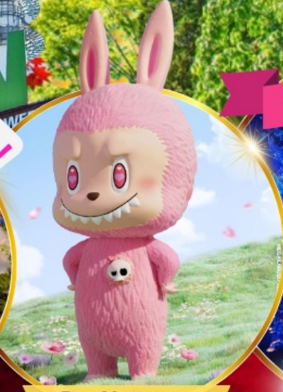
Pop Mart สงแด