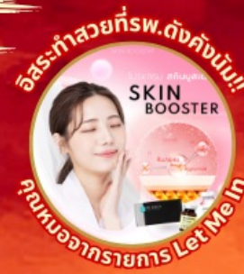
อิสระทำสวยที่พ.ดังคังนัม!! SKIN BOOSTER คุณหมอจากรายการ Let Me In

ที่เที่ยวยุคใหม่ล่าสุด รีสอร์ท 5ดาว ใหญ่ที่สุดในเอเชียเหนือ แวะคาเฟ่ดัง เปลี่ยนธีมสวยตามเทศกาล เข้าชมถ้ำอดีตเหมืองทอง คล้องใจที่กุญแจ โซล ทาวเวอร์