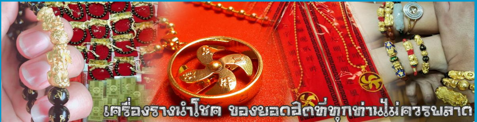
เครื่องรางนำโชค ของยอดฮิตที่ทุกท่านไม่ควรพลาด

จากนั้นนำท่านสู่ ร้านหยก ชมความงามปีเซียะ ที่เชื่อกันว่าเป็นวัตถุมงคลยอดนิยม ที่มีการนำมาบูชา เพื่อให้ช่วยป้องกันสิ่งชั่วร้าย เรียกทรัพย์สินเงินทองให้ไหลมาเทมา และกักเก็บทรัพย์นั้นไม่ให้รั่วไหลออกไปไหนได้ ชาวจีนโบราณเชื่อกันว่า ปีเซียะเป็นสัตว์ประหลาดที่รวมลักษณะของสัตว์มงคลทั้ง 5 ชนิดไว้ด้วยกัน ได้แก่ มังกร พญาราชสีห์หรือสิงโต, อินทรี, กวาง, และแมว โดยตามตำนานเล่าว่า ปีเซียะเป็นลูกมังกรตัวที่ 9 (เทพแห่งโชคลาภ) ของพญามังกรสวรรค์ มีชื่อเรียกด้วยกันหลายชื่อไม่ว่าจะเป็น “เทียนลก (กวางสวรรค์)” เป็นชื่อเดิม ส่วนจีนกวางตุ้งจะเรียกว่า “เผ่เย้า” และคนจีนแต้จิ๋วจะเรียกว่า “ผีซิว”