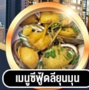
เมนูซีฟู้ดลีสุมบุน