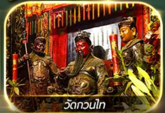
วัดกวนไท

ไหว้ 8 เซียนวัดดัง ปิงไม่หยุด ครบถ้วน!! การเงิน การงาน ความรัก และสุขภาพ