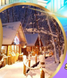
หมู่บ้านเทพนิยาย นิงเกิ้ลเทอเรส