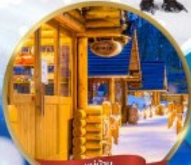
หมู่บ้าน NINGLE TERRACE

สนุกสนาน ณ ลานสกี • หมู่บ้านราเมนอาซาฮิคาว่า • หมู่บ้านนิงเกิลเทอเรส ขบวนพาเหรดเพนกวิน ณ สวนสัตว์อาซาฮิคาว่า • โรงงานช็อกโกแลต โอดารุ • ศาลเจ้าฮอกไกโด • พระใหญ่ HILL OF BUDDHA