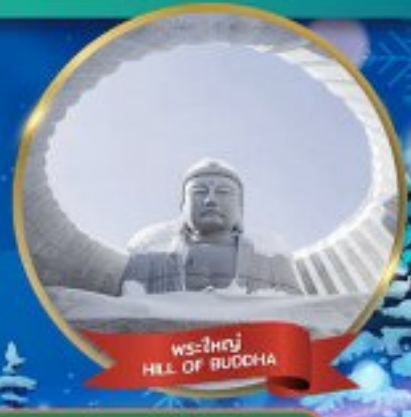
พระใหญ่ HILL OF BUDDHA

พักอาซาฮิคาว่า 1 คืน - โอดารุ 1 คืน - ซัปโปโร 2 คืน (ติดย่านช้อปปิ้ง)