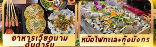
อาหารเวียดนาม ดนตรี