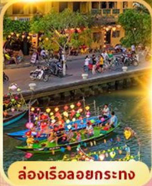
ล่องเรือลอยกระทง