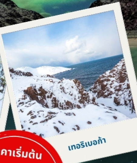
เทอริเบอก้า