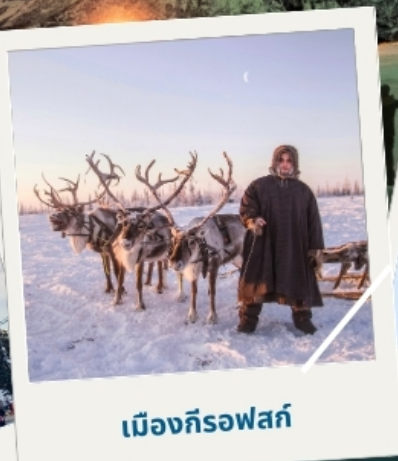
เมืองก็รอฟสค์