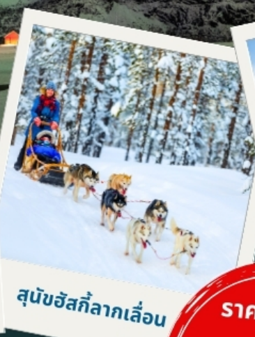
สุนัขฮัสกีลากเลื่อน