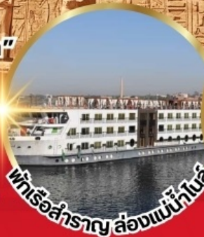
พเรือสำราญ ล่องแม่น้ำไนล์

*เงื่อนไขเป็นไปตามที่บริษัทกำหนดเท่านั้น*