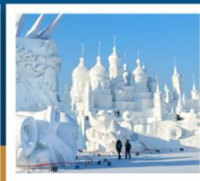
เกาะพระอาทิตย์