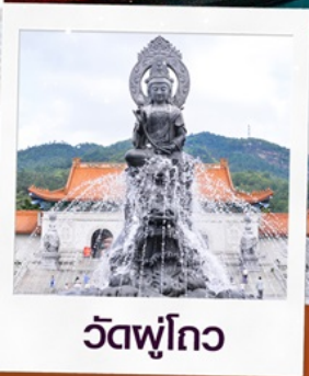
วัดฟูโกว