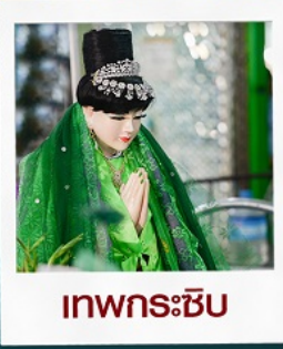
เทพกระเซิบ