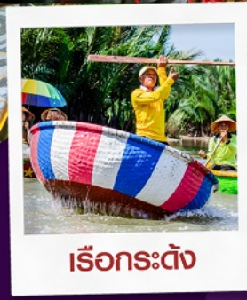
เรือกระด้าง