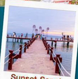
Sunset Sanato Beach Club