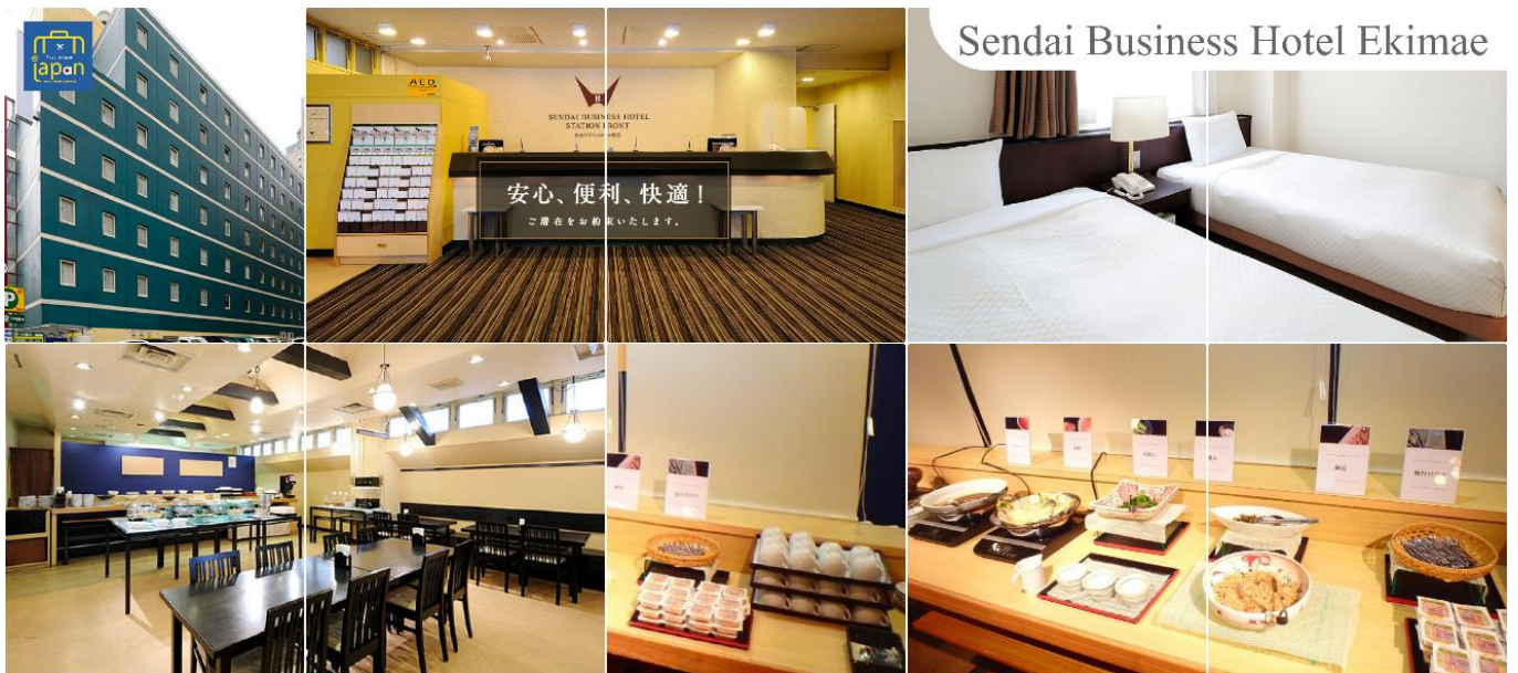
Sendai Business Hotel Ekimae

SENDAI BUSINESS HOTEL EKIMAE หรือเทียบเท่าระดับเดียวกัน