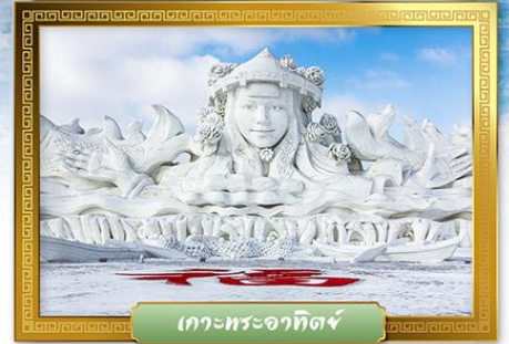
เกาะพระอาทิตย์