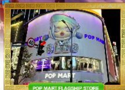
POP MART FLAGSHIP STORE