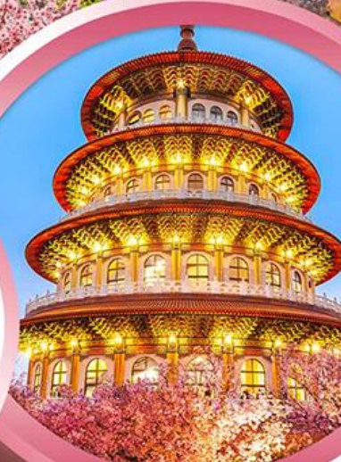
วัดจู้เทียนหยวน

ช้อปปิ้งจุใจ ย่านซีเหมินติง ตลาดโจงโนก่มาร์เก็ต อิมอร่อยกับ..เมนูปลาประรานาธิบติ ชาบูบุฟเฟ่ต์สไตล์ไต้หวัน เสียวหลงเปา