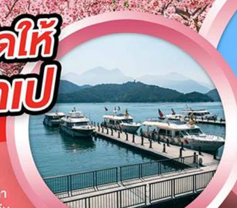
ล่องเรือทะเลสาบสุรียันจินทรา