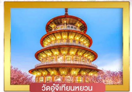
วัดอู่จีเทียนหยวน