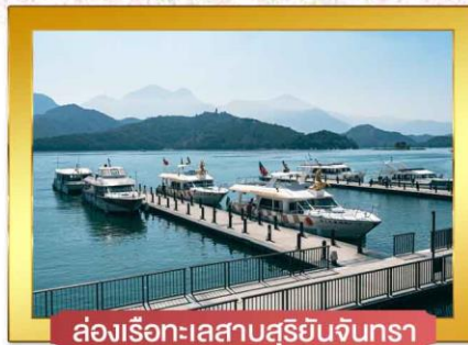
ล่องเรือทะเลสาบสุริยันจันทรา