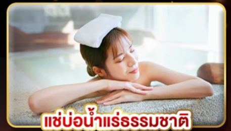
แช่น้ำแร่ธรรมชาติ