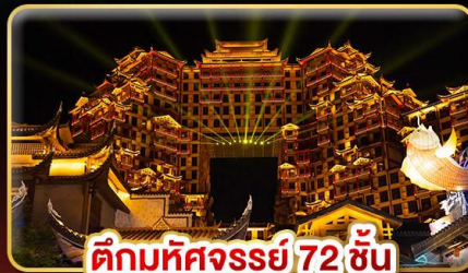
ตึกมหิศรรย์ 72 ชั้น