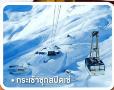
กระเช้าชุกสปีตเซ่