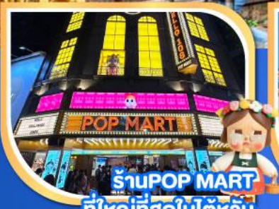
ร้าน POP MART ที่ใหญ่ที่สุดในโลก