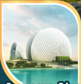
โรงละครหอยโข่งมุก