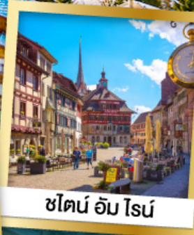
ชิลอน อัม โรน