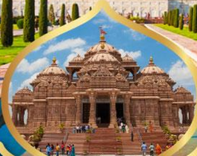
วิหารอักชาร์ดัม