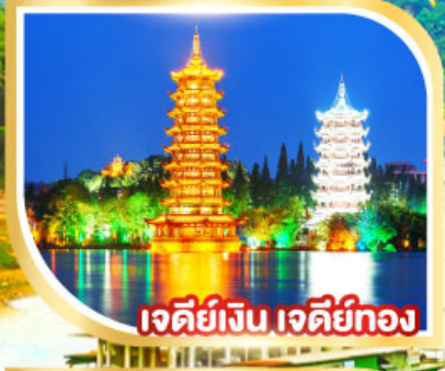
เจียดี้จิน เจียดี้ทอง