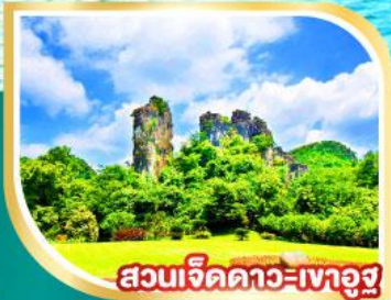
สวนเจ็ดดาว-เกาอูซู่