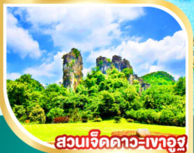
สวนเจ็ดดาว=เงาอูจ