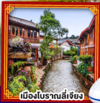
เมืองโบราณลี่เจียง