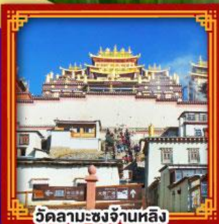
วัดลามะชงจ่านหลิง