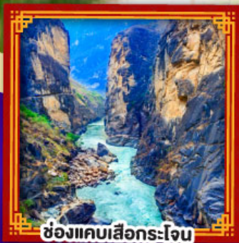
ช่องแคบเสื่อกระโจน