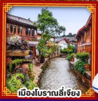
เมืองโบราณลี่เจียง