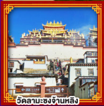
วัดลามะชงจ้านหลิ่ง