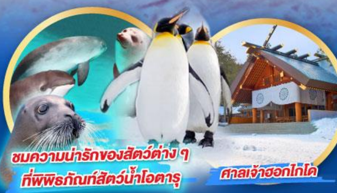
ชมความน่ารักของสัตว์ต่าง ๆ ที่พิพิธภัณฑ์สัตว์น้ำโฮตารุ