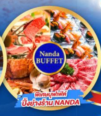
พิเศษบุฟเฟ่ต์ บึงย่างร้าน NANDA

เดินทาง (วันปีใหม่ 2568) 27 ธ.ค.-01 ม.ค. 68 29 ธ.ค.-03 ม.ค. 68