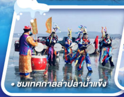
• ชมเทศกาลล่าปลาน้ำแข็ง