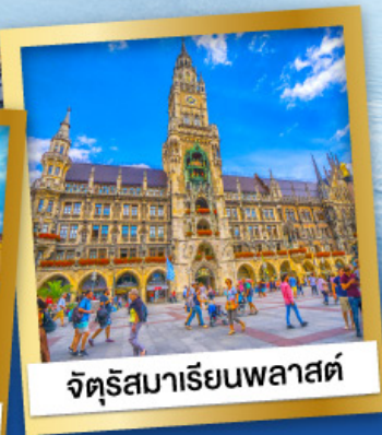
จัตุรัสมาเรียนพลาสต์