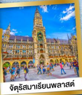
จัตุรัสมาเรียนพลาสต์

28 ธ.ค.67-05 ม.ค.68 95,900 12-20 ก.พ., 12-20 มี.ค.68 89,900