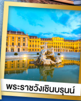
พระราชวังเซ็นบรุนน์