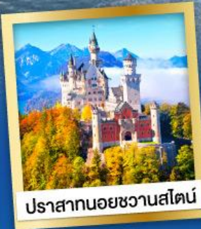
ปราสาทนอยชวานสไตน์