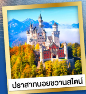
ปราสาทนอยชวานสไตน์