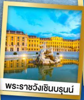
พระราชวังเซ็นบรุนน์