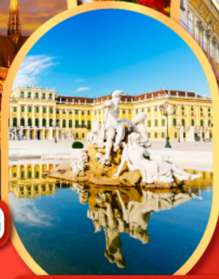
พระราชวังซินบรูนน์