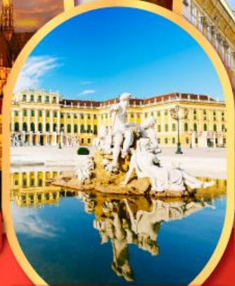
พระราชวังซินบรูนน์